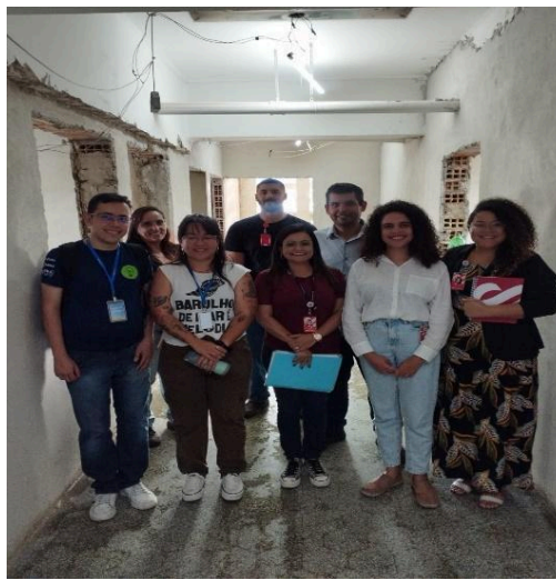
Equipe Semente e Santa Casa. Data: 12/12/2024

O projeto Flores de Abril tem como objetivo a construção de uma unidade transitória de neonatal, atendendo os itens de regularização sanitária para subsidiar os pacientes durante a reforma da unidade neonatal existente no hospital Santa Casa de Misericórdia de Belo Horizonte.