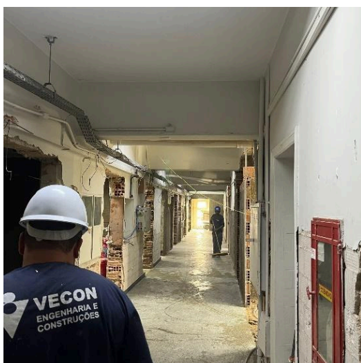
Demolição das alvenarias existentes e construção das novas alvenarias.