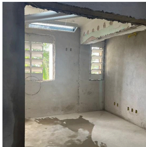
Acabamento inicial das novas alvenarias, pontos para ligações elétricas e novas esquadrias. Data: 12/12/2024