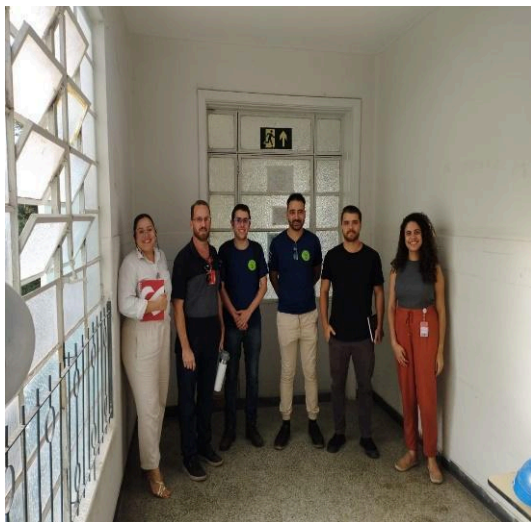
Equipe Semente e Santa Casa. Data: 18/11/2024

Nos dias 18 de novembro de e 12 de dezembro de 2024, a equipe do Semente participou das visitas técnicas à Santa Casa de Belo Horizonte, onde estão sendo realizadas as atividades do projeto Flores de Abril .